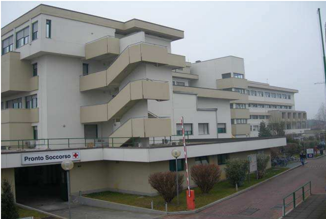
Impianti c/o ospedale vecchio di Adria